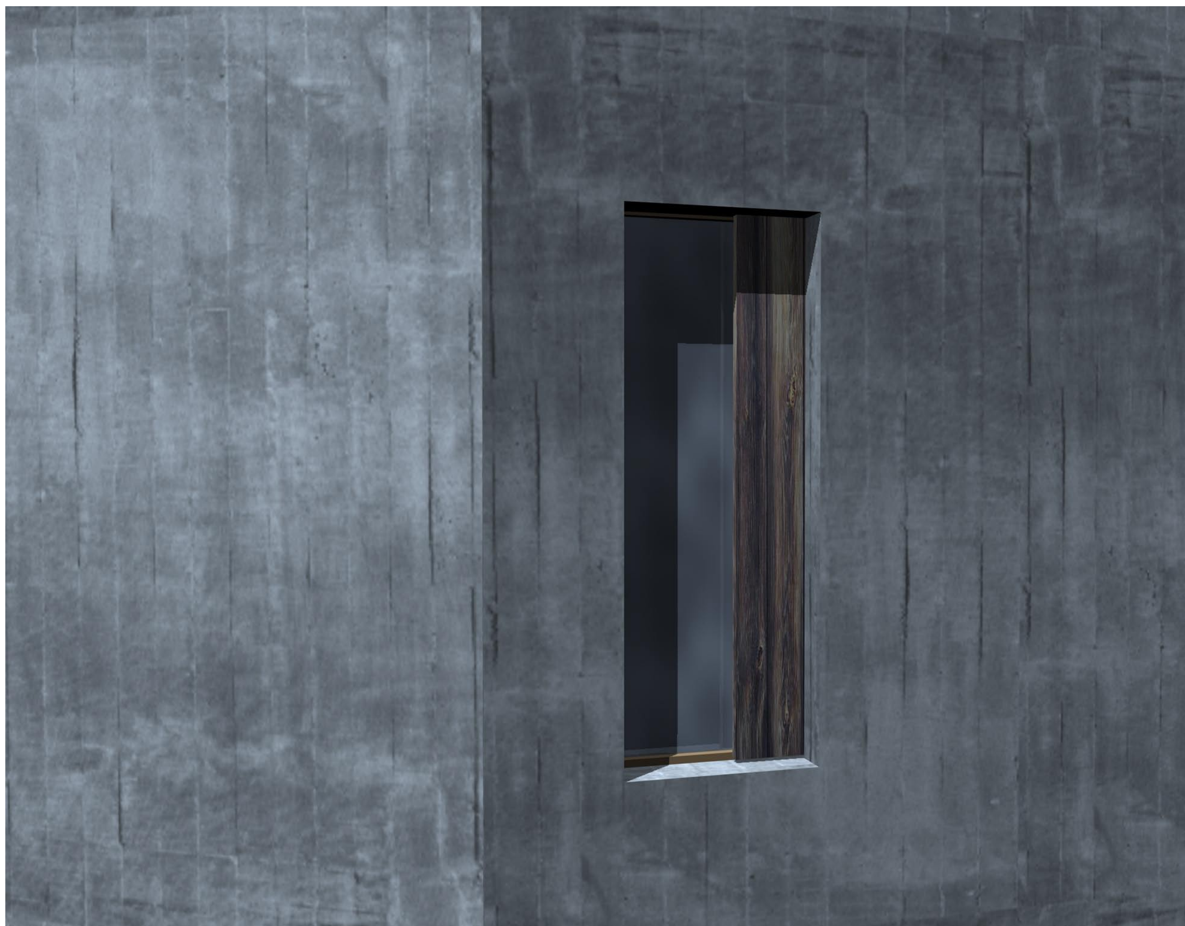
AUSSCHNITT FASSADE M 1:10