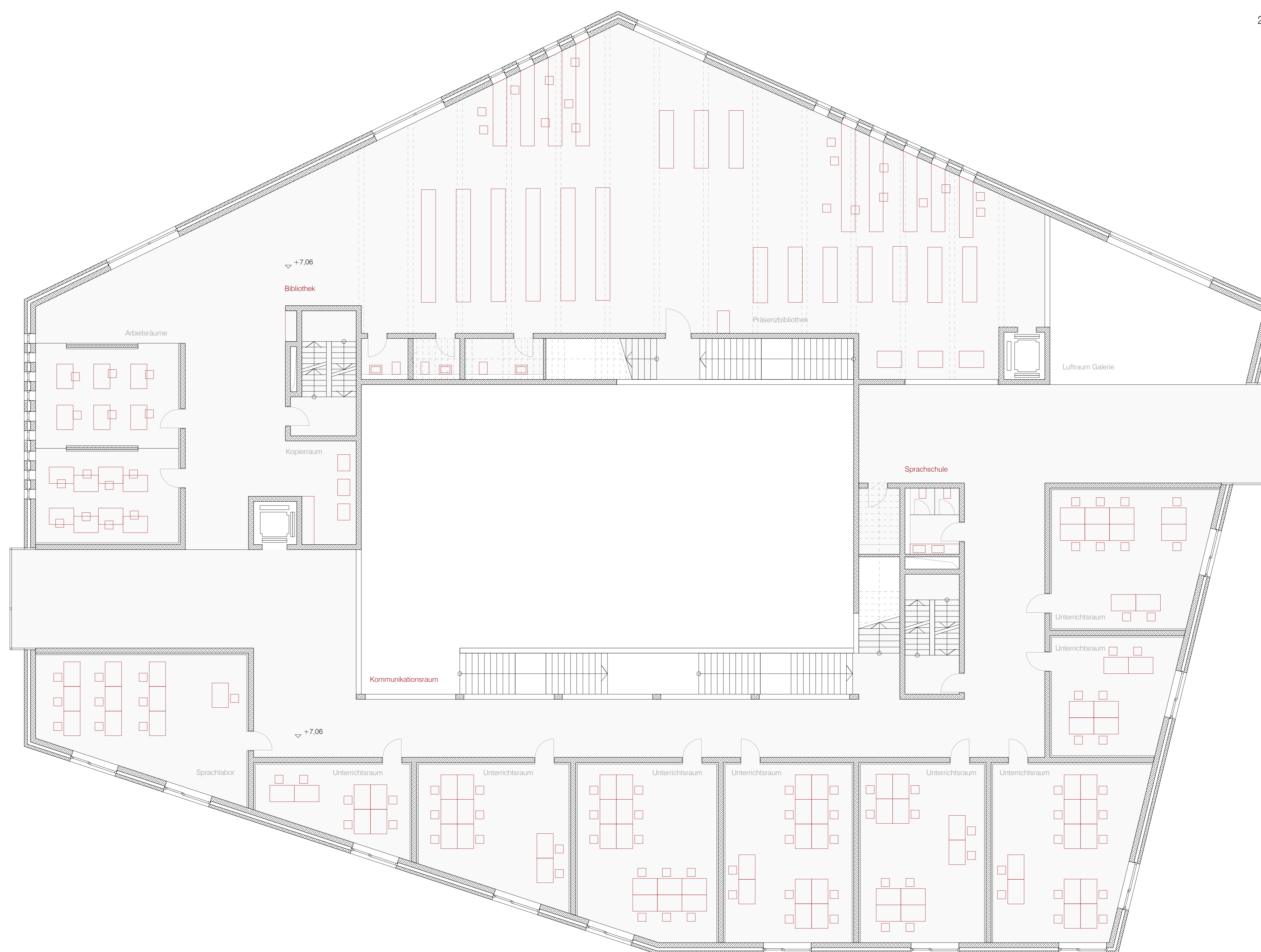
Grundriss 1. Obergeschoß 1:100