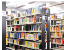
Teilbibliothek Sport & Gesundheitswissenschaften