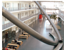
Teilbibliothek Mathematik & Informatik