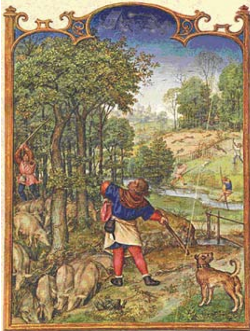
Abb. 1 : Historische Haltung von Schweinen im Wald Die Eichelernte und die Hasenjagd im November (Breviarium Grimani, »November«, Flandern, ca. 1510; aus Faksimile cod. marc. Lat. I, 99 (2138), © mit Genehmigung Bibliotheca Nazionale Marciana, Uff. Manoscritti).

Die ersten Ergebnisse waren viel versprechend und die Nachfrage