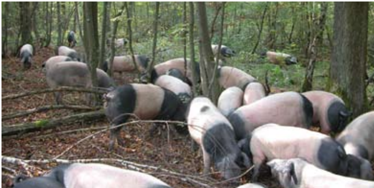
Abb. 2 : Weidende Schwäbisch-Hällische Schweine im Possenheimer Wald bei Iphofen

Während der Projektlaufzeit wurden weitere bauliche Verbesserungen ohne Förderung vorgenommen, wie beispielsweise der Bau eines überdachten Fangstandes zur Tierkontrolle und einer Liegehalle.