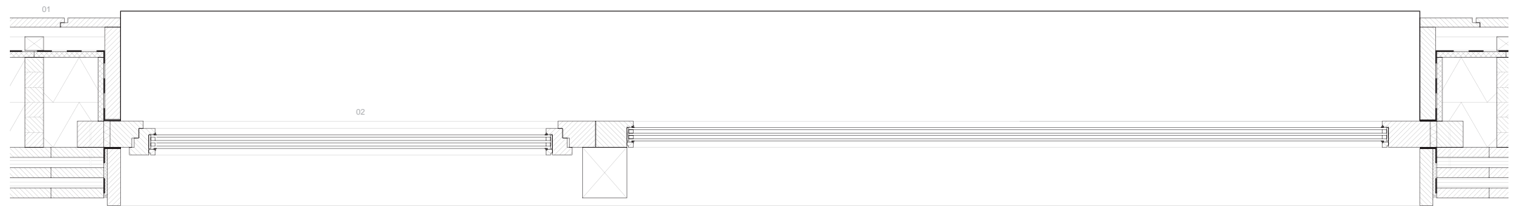
Grundriss M 1:5