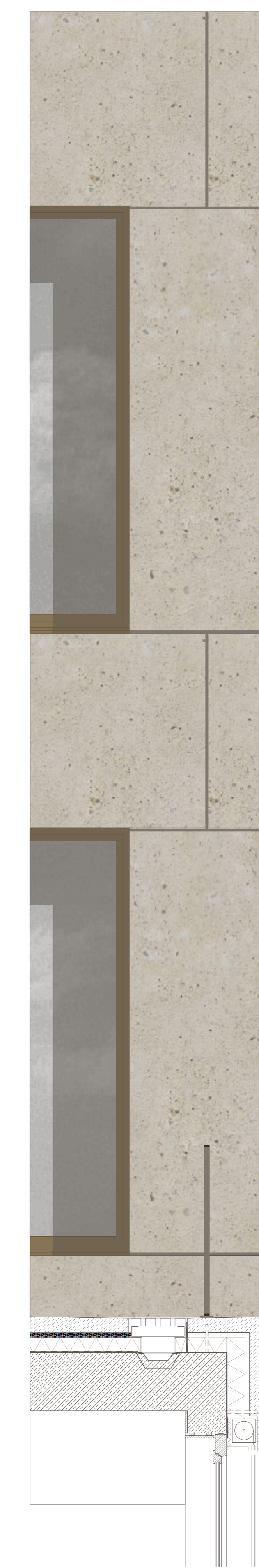
Fassadenschnitt M 1:20

Terrassenaufbau: Betonwerkstein mit Muschelkalk 100 mm Spinnbett > 20 mm Schutzvlies Wärmedämmung im Gefälle 100 mm 2-lagige Bitumenabdichtung vollflächig verklebt Stahlbetondecke mit Betonkernaktivierung 350 mm Stahlbetonunterzug 600 mm