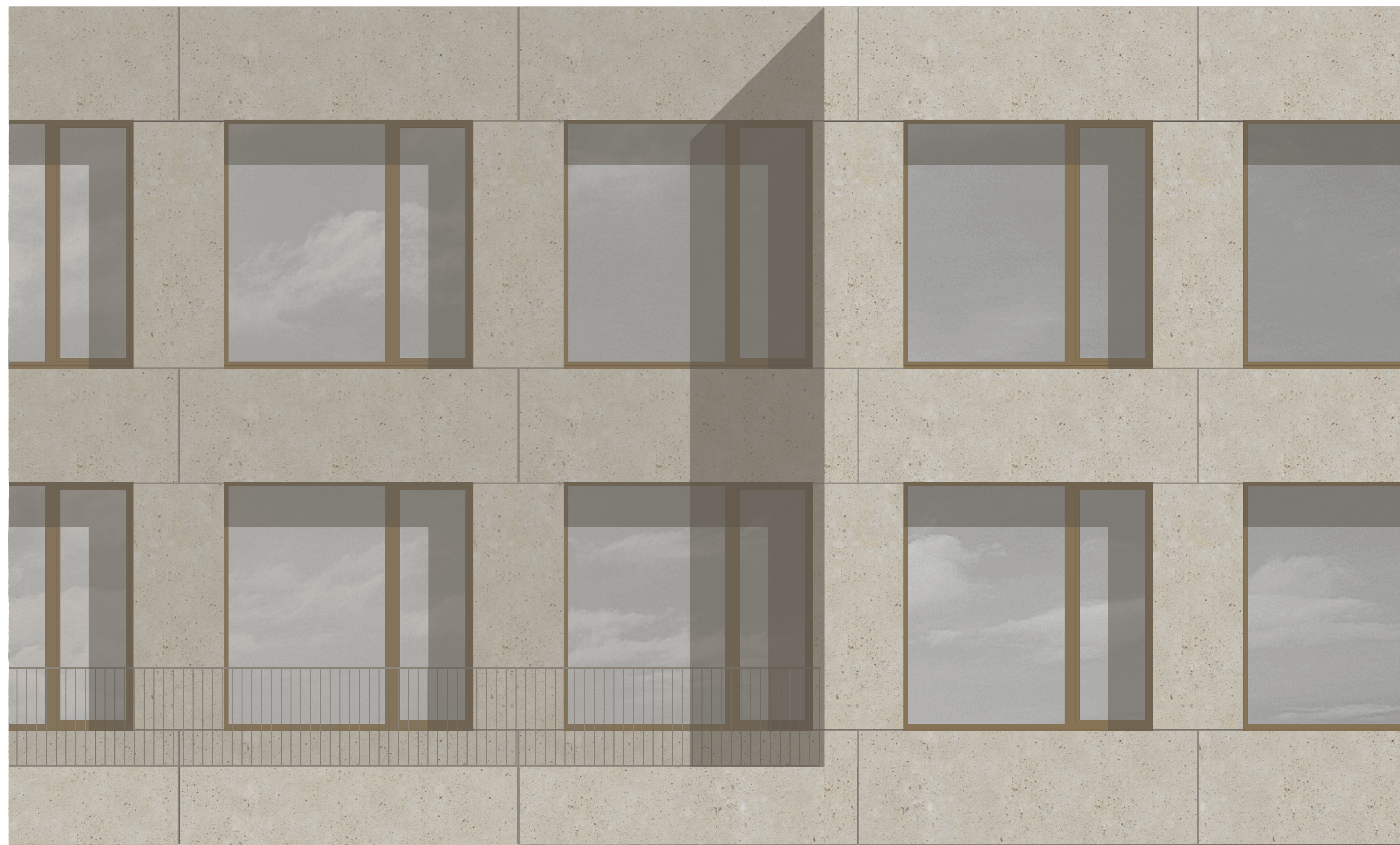
Fassadenansicht M 1:20