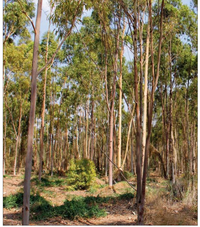
Abb. 2: 9-jähriger Eucalyptus camaldulensis -Bestand

forstungen eine Rolle bei der Bekämpfung der fortschreitenden Bebauung des knappen Ackerlandes im Nildelta, eine der größten Herausforderungen Ägyptens, spielen. Die illegalen Bebauungsflächen beherbergen Zuwanderer aus ländlichen Gebieten mit niedrigen Einkommen. Die Forstplantagen liegen unweit der Städte in Wüstengebieten. Die Plantagen stellen, wenn sie entsprechend gestaltet sind, eine Attraktion für diese Bevölkerungsgruppe dar, da eine Anbindung an den Nil und das Nildelta mit seinen grünen Flächen gegeben ist. Die Menschen sind eher bereit, sich in der Nähe solcher Forstplantagen als inmitten einer Wüstenregion ohne Grünflächen niederzulassen.