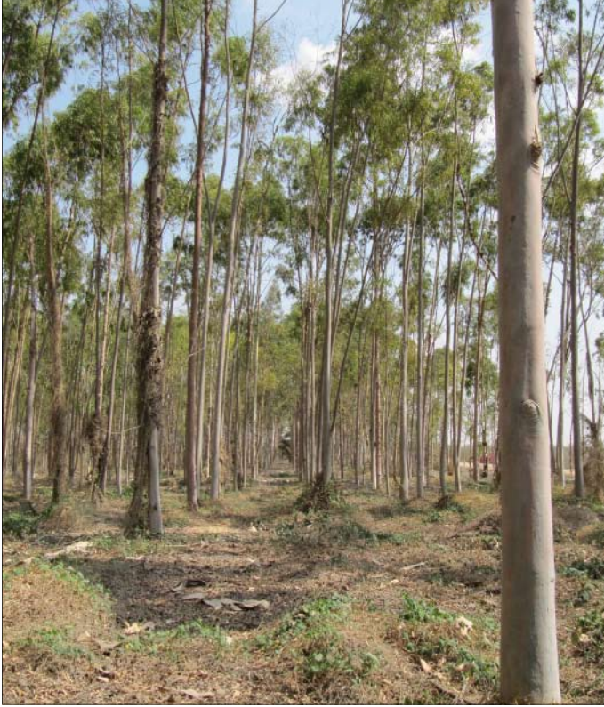
Abb. 1: 8-jähriger Eucalyptus citriodora -Bestand