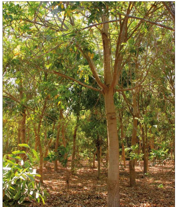
Abb. 3: 4-jähriger Khaya senegalensis -Bestand

Der Lehrstuhl für Waldbau der TU München hat sich in der Vergangenheit immer wieder mit internationalen Waldbaufragen befasst [8] und war deshalb auch sofort bereit, mitzuhelfen bei der Beschaffung der notwendigen Informationen über den Zustand und das Potenzial der Aufforstungen in Ägypten. Als erster