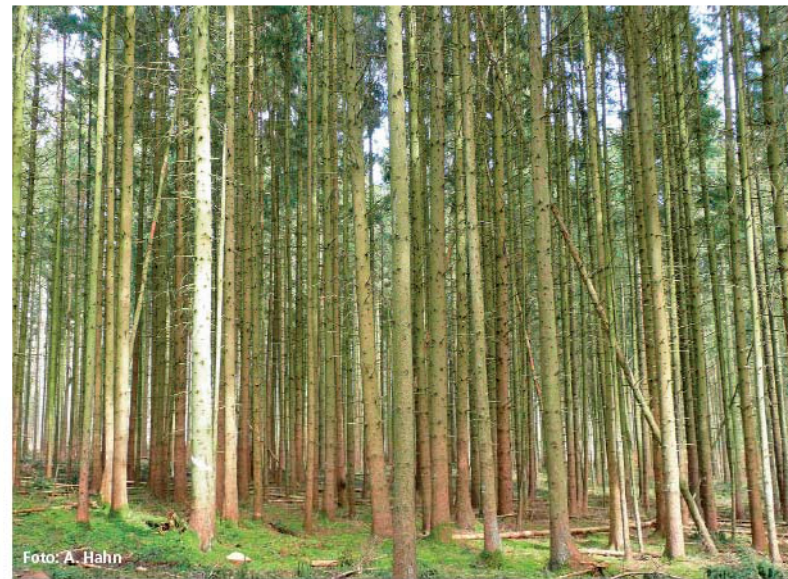
Abbildung 2: Blick in eine dauerhaft undurchforstete Parzelle des Freisinger Fichtendurchforstungsversuches im Dezember 2007

Die übrigen acht Durchforstungsvarianten unterscheiden sich hingegen kaum. Die Ergebnisse könnten als Punktwolke zwischen den beiden Behandlungsextremen dargestellt werden. So kann als ein Fazit festgehalten werden, dass nur kräftige Durchforstungen Mehrzuwächse und Stabilitätsgewinne der Fichten bewirken.